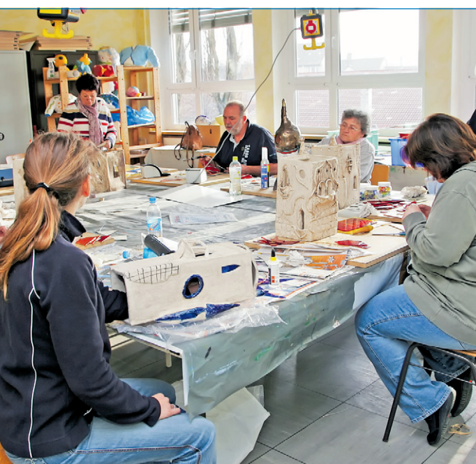
Kreativität und Geschicklichkeit sind gefragt beim Ton- und Keramikseminar.

können bei der VHS Völklingen, Altes Rathaus, 66333 Völklingen unter der Telefonnummer (0 68 98) 13-25 97 oder der E-Mail-Adresse info@vhs-voelklingen.de angefordert werden. Der Download des gesamten Programmheftes und die Anmeldung kann auch per Internet erfolgen unter www.vhs-voelklingen.de .