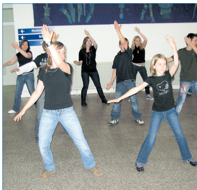
Tai Chi Chuan-Kurse sind immer wieder beliebt.