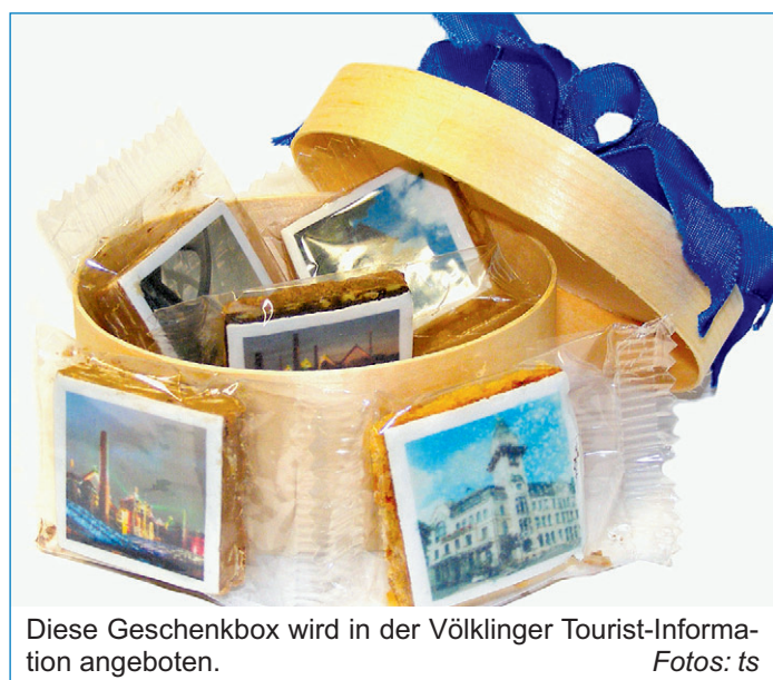
Diese Geschenkbox wird in der Völklinger Tourist-Information angeboten.

Die Völklinger Tourist-Information im Alten Bahnhof bietet verschiedene Werbepartikel und Präsente zu Völklingen zum Verkauf an. Erweitert wurde die bisherige Auswahl der Verkaufsprodukte durch die „Völklinger Plätzchen“ und eine T-Shirt Kollektion. Erstmals wurden die „Völklinger Plätzchen“ im Dezember zum Verkauf angeboten. Die „Völklinger Plätzchen“ werden in einer schönen Geschenkbox angeboten, sind auf der Oberseite mit Völklinger Motiven versehen und in den Geschmacksrichtungen Orange, Schoko, Mandel und Praline erhältlich. Zu sehen sind zum Beispiel das Weltkulturerbe und das Alte Rathaus sowie andere bekannte Sehenswürdigkeiten der Stadt. Aufgrund des großen Verkaufserfolges wird jetzt noch ein Restbestand der li-